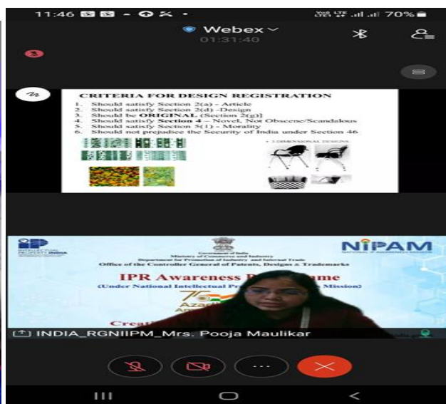
Guest Lecture on IPR(13/01/2022)