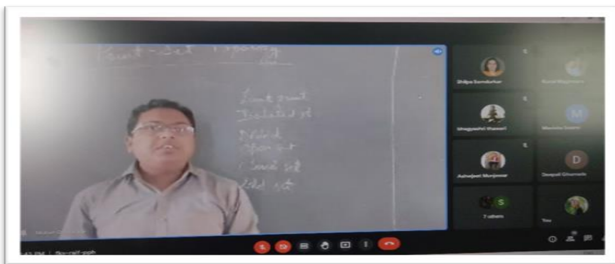
Online Guest Lecture on Real Analysis (26/11/21)