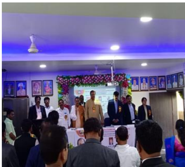
State Level Workshop on IPR(21/08/2021)

Guest Lecture delivered : 01 Topic -Mathematics Day (22/12/2021)