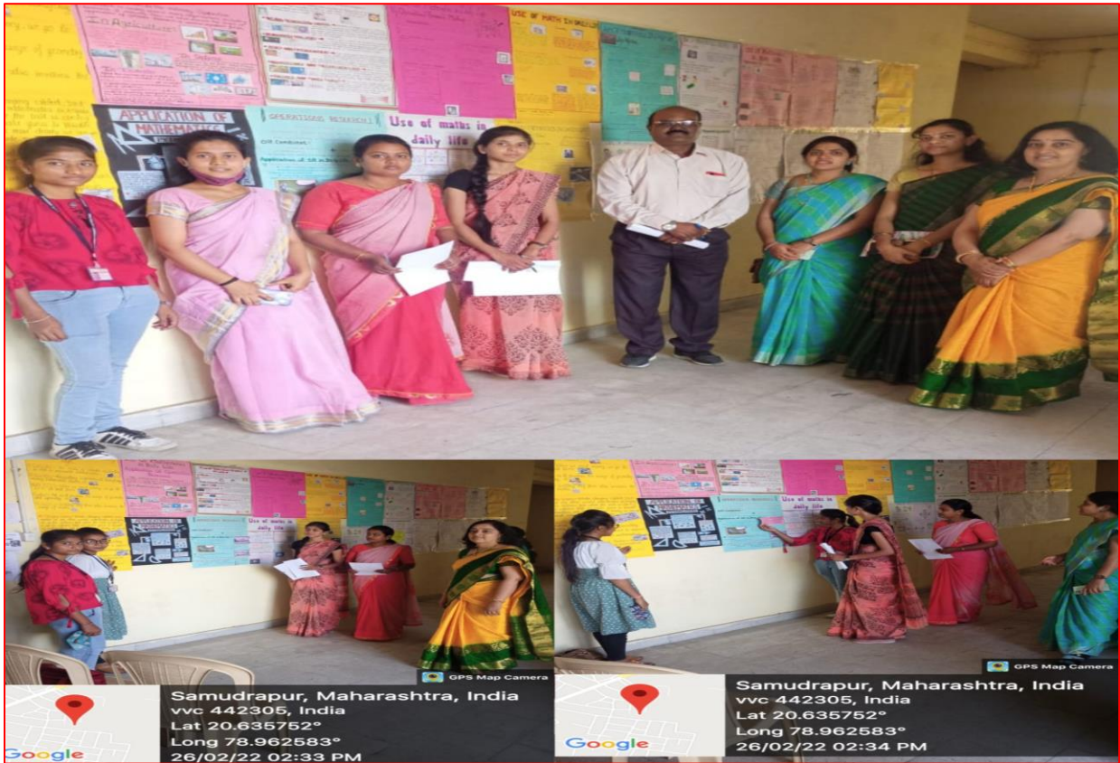
Best Practice --Poster Presentation : Applications of Mathematics (26/02/2022)