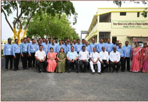
नॅक पिअर टीम सोबत अध्यक्ष, सचिव, प्राचार्य, व शिक्षकेतर कर्मचारी