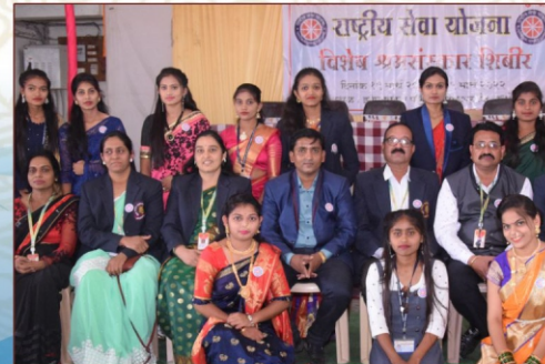
रा.से.यो. कार्यक्रम अधिकारी व पुरस्कार प्राप्त विद्यार्थी