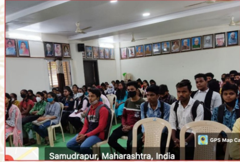
वाणिज्य अभ्यास मंडळाच्या उद्घाटन प्रसंगी उपस्थित विद्यार्थी व विद्यार्थिनी