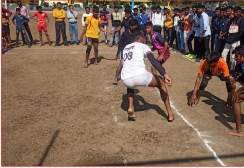
सांस्कृतिक महोत्सवा निमित्त आयोजित कबड्डी या स्पर्धामध्ये सहभागी विद्यार्थी