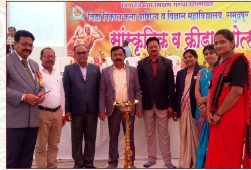
सांस्कृतिक व क्रीडा महोत्सवाचे उद्घाटन करताना मान्यवर