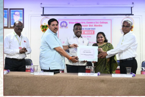
नॅक पिअर टिम प्राचार्यांना अहवाल सादर करताना