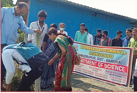
वनस्पतीशास्त्र विभागाद्वारे आयोजित वृक्षारोपन कार्यक्रमांमध्ये उपस्थित विद्यार्थी व प्राध्यापक वृंद