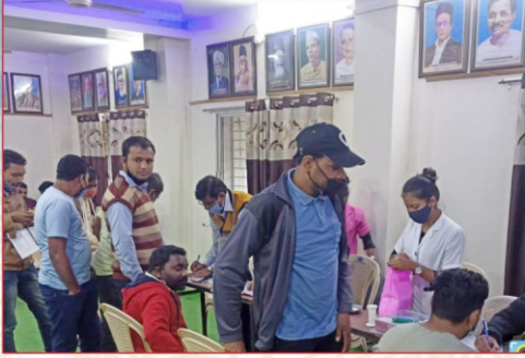
रा.से.यो च्या वतीने रक्तदान शिबीराचे आयोजन