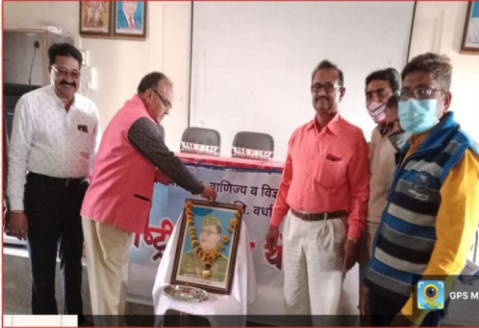
नेताजी सुभाषचंद्र बोस यांच्या प्रतिमेचे पुजन करतांना प्राध्यापक वृंद