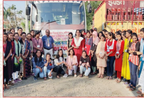
शैक्षणिक सहल प्रसंगी उपस्थित प्राध्यापक व विद्यार्थी