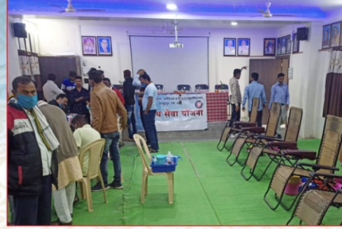
रा.से.यो च्या वतीने रक्तदान शिबीरामध्ये नोंदणी करताना विद्यार्थी