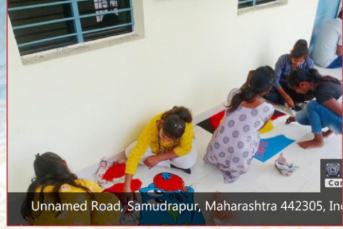
Unnamed Road, Samudrapur, Maharashtra 442305, In