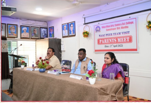
नॅक टिमची महाविद्यालयास भेट