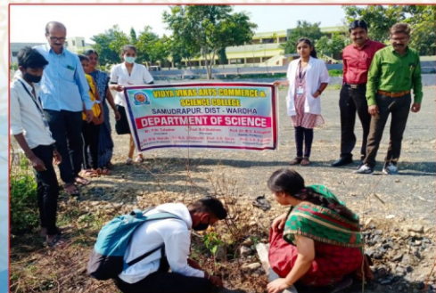
वनस्पतीशास्त्र विभागाद्वारे आयोजित वृक्षारोपन कार्यक्रम