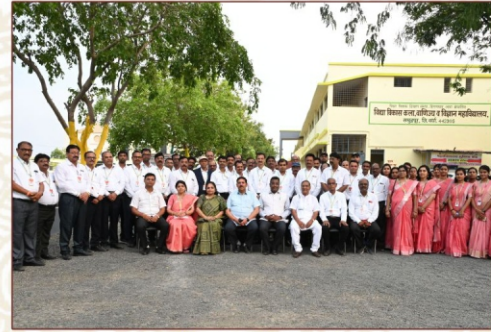
नॅक पिअर टीम सोबत अध्यक्ष, सचिव, प्राचार्य, व शिक्षकेतर कर्मचारी