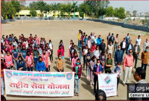
रा.से.यो.च्या वतीने राष्ट्रीय मतदार दिवस रॅलीचे आयोजन