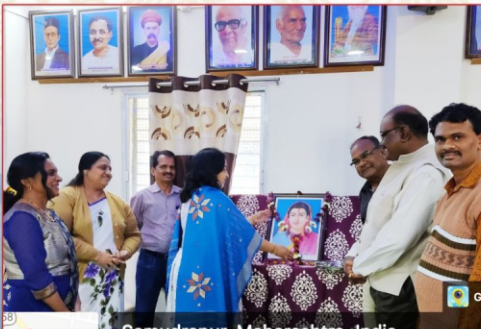
सावित्रीबाई फुले जयंतीच्या कार्यक्रमात उपस्थित प्राध्यापक वृंद